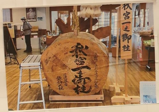
おんばしら館 よいこ