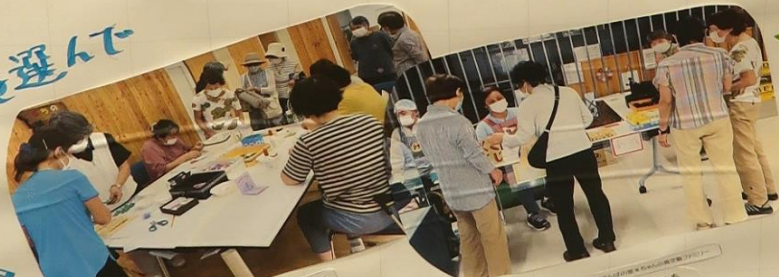
エコクラフトで花フローラ 折り紙で忍者・コマなど