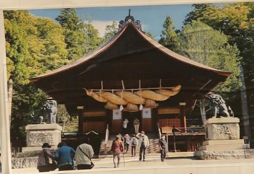
諏訪大社下社秋宮