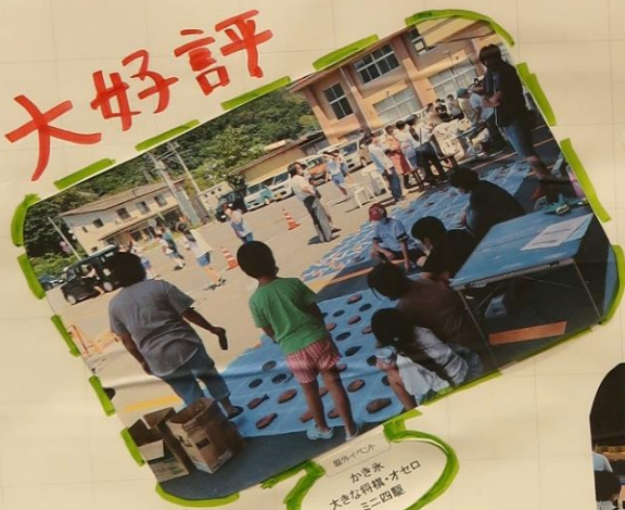
観音中心 かき氷 大きな荷籠、オセロ ミニ四駆