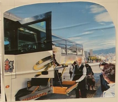
アリーナバス (リフト付)