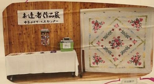
作品展 ふれあいの里作品展 おたっしや作品展